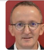
N. HUOT-MARCHAND LAFARGEHOLCIM (16)