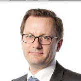
Thomas GAUTHEROT TOTAL Raffinage