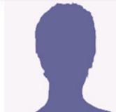
K. ANNADOURAI H.V KAS