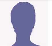
J-P BELLE IDRA Environnement